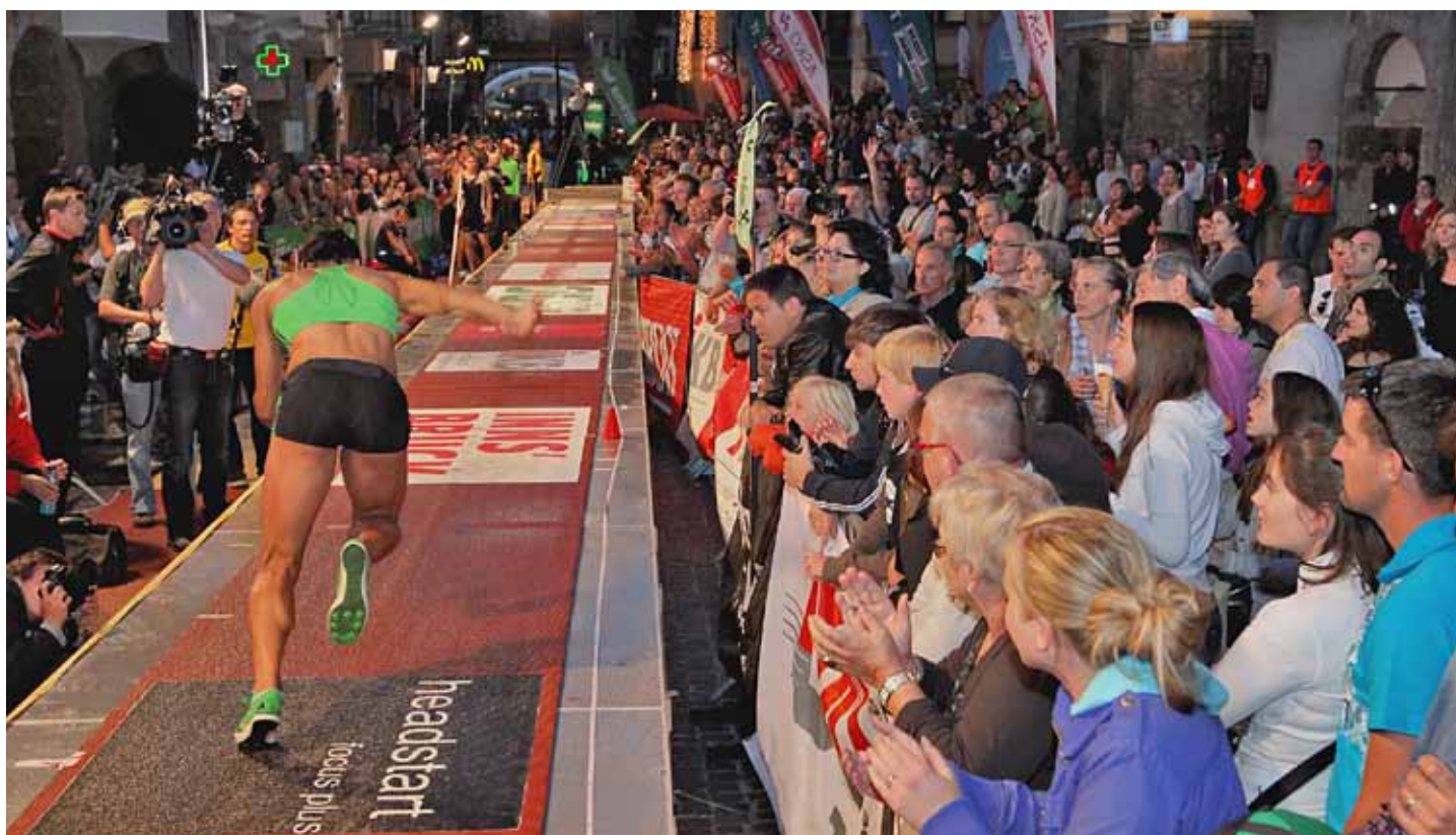
Über 4000 begeisterte Fans säumten wieder – trotz des Fußball-Länderspiels Deutschland/Österreich und Schlechtwetters – die weltweit einzigartige, 72 Meter lange und über 30 Tonnen schwere mobile Kombinationsanlage in der Altstadt.