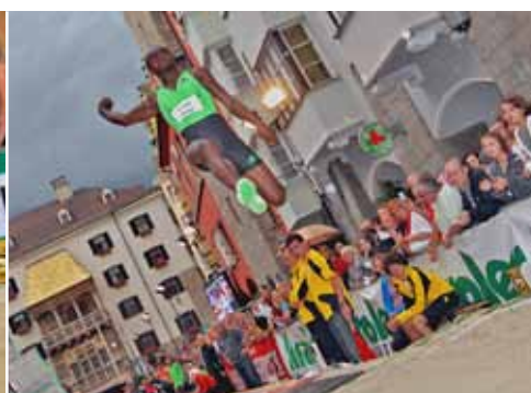
So schön und leicht kann Fliegen sein: Nach dem Abdruck bei einer Anlaufgeschwindigkeit von 41 km/h nähert sich Weltmeister und Meeting-Rekordhalter Ignisious Gaisah (GHA) der 8-Meter Marke.