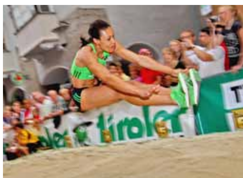
Welt- und Europameisterin Naide Gomes aus Portugal – die bislang einzige Frau im erlesenen „all-time“ Starterfeld der Golden Roof Challenge – mit einer persönlichen Bestmarke jenseits der 7 Meter (7,12 m).