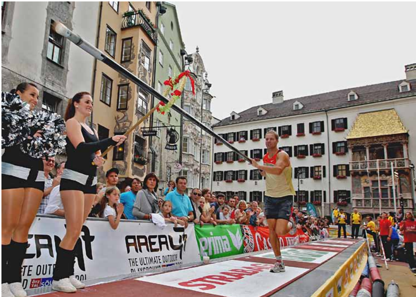
Das traditionelle „Kranzstechen“ – die Vorstellung der Stabhochsprung-Weltklasse-Athleten – wurde wieder zum Publikumsspektakel.