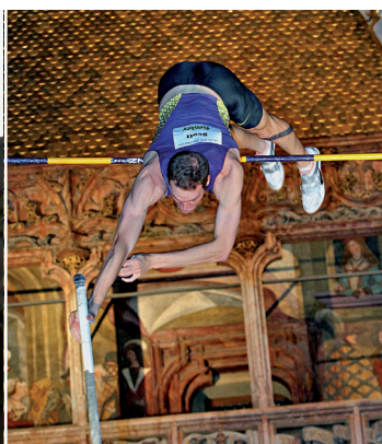
Spektakuläre Sprünge und Emotion pur sind bei der 9. Auflage der Int. Golden Roof Challenge im Herzen Innsbrucks wieder garantiert.